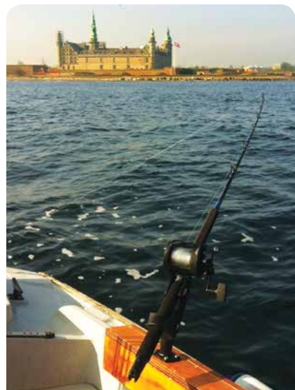
Den første fisketur med Kronborg i baggrunden. Turen var ved at ende galt.